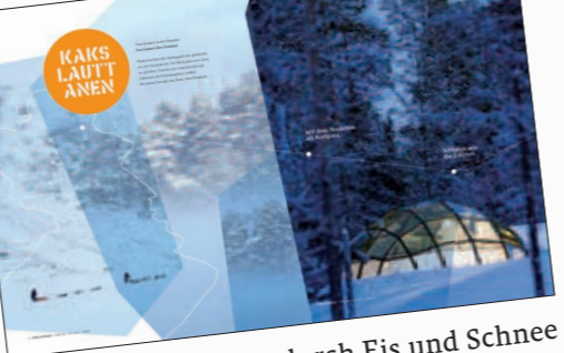
... in die gemütlichen Iglus von Kakslautanen. Und endlich - das Polarlicht am nächtlichen Himmel!

42 MEXIKO Den Dia de los Muertes in Oaxaca feiern SEITE 216