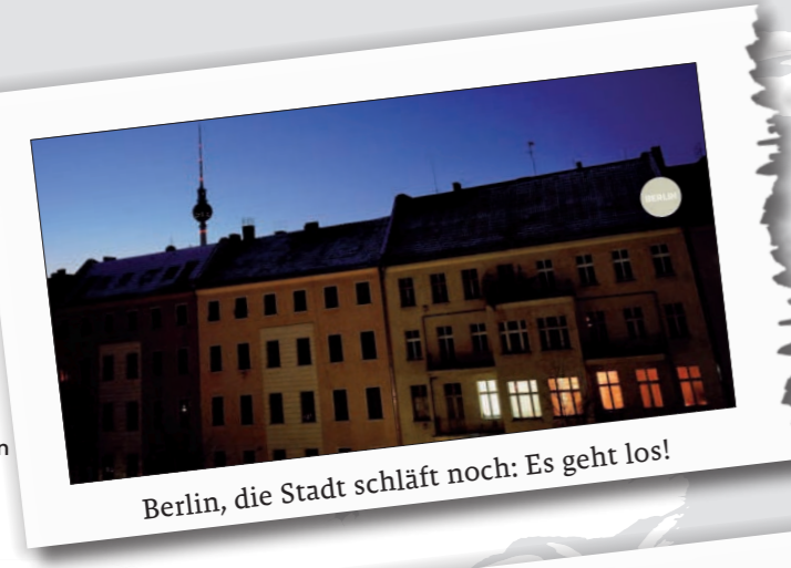
Berlin, die Stadt schläft noch: Es geht los!

44 KANADA Den echten Powder in den Rockies erleben SEITE 224