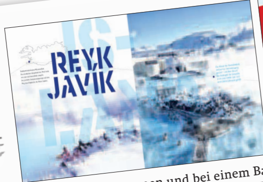
In Reykjavik ankommen und bei einem Bad in der Blauen Lagune dem Winter trotzen. Weiter geht die Reise durch Eis und Schnee ...

45 LAS VEGAS Mehr Fun erleben Stratosphere Tower SEITE 228