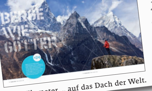
Bahnfahrt auf Permafrost: Mit der Tibetbahn von Golmud nach Lhasa geht es rund 1000 Kilometer ... auf das Dach der Welt.

INDONESISIEN den Bauch der Erde schauen SEITE 100