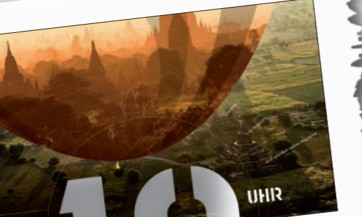
Der Tag ist noch jung als der Ballon langsam in die Höhe steigt, bis Bagan immer mehr entrückt ...

35 ARGENTINIEN Grillen bis zum Abwinken SEITE 176