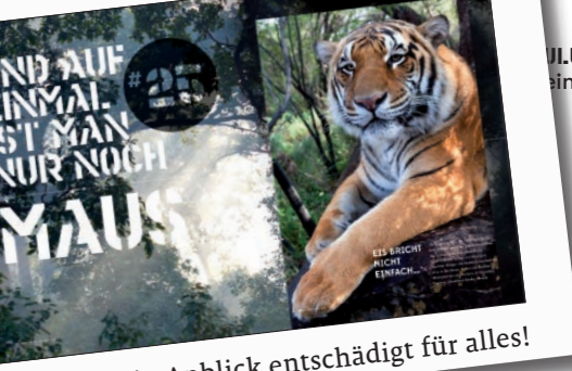
Bergwelt ade, ab in das nepalesische Tiefland! Das Gras ist so hoch wie die Luftfeuchtigkeit, aber sein Anblick entschädigt für alles!