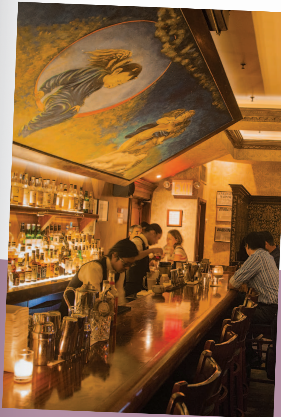
Versteckte Bar im East Village mit vielversprechendem Namen: Angel's Share