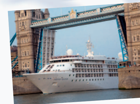
Heutzutage öffnet sich die Brücke nur noch durchschnittlich 20-mal in der Woche.